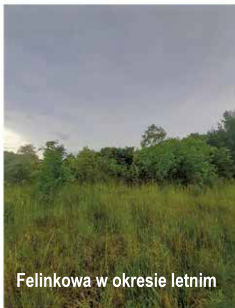
Felinkowa w okresie letnim