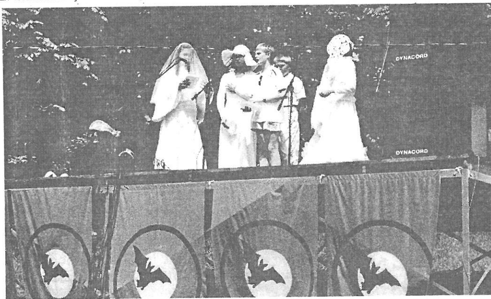
„Duchy” Zamku Ogrodzienieckiego prezentują naszą gminę w Złotym Potoku

Organizatorzy dziękują uczestnikom jak również opiekunom za staranne przygotowanie i zapraszają do udziału w kolejnych konkursach.