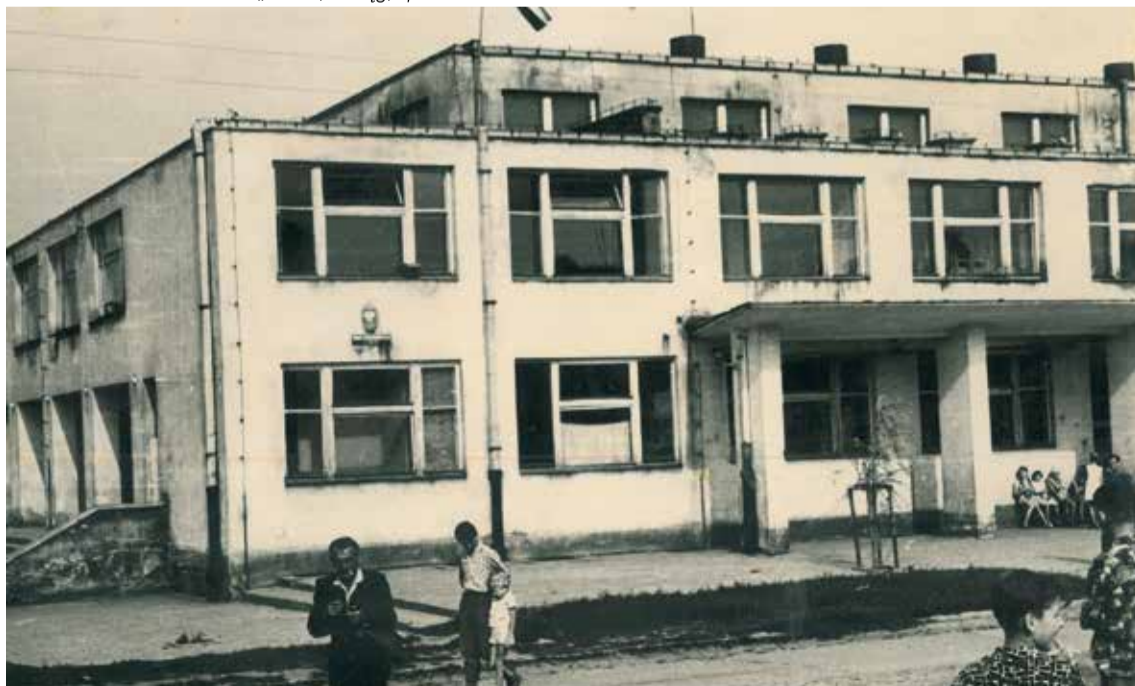
Szkola Podstawowa w Elblągu – miejsce kolonii letnich 1964r.