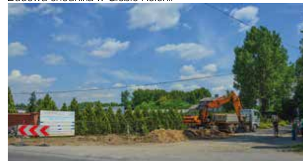
Budowa kanalizacji sanitarnej w Cementowni