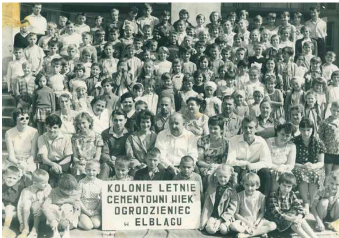
Kolonie letnie Cementowni „Wiek”, Elbląg, lipiec 1964 turnus I