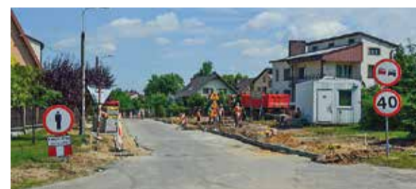
Przebudowa ul. Południowej w Ogrodzieńcu