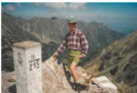
Doktor na wyprawie w górach