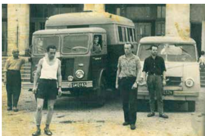
Tymi samochodami jeździliśmy na wszystkie wycieczki, Elbląg 1964r.