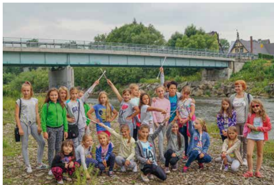
Nad Białym Dunajcem