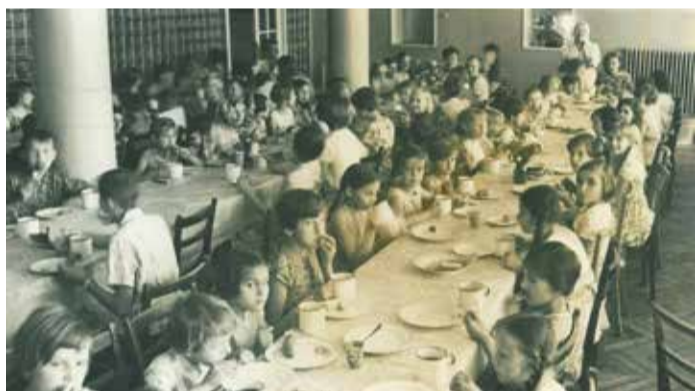
Kolonie letnie Cementowni „Wiek”, Elbląg, 1964 turnus I, ogólny widok jadalni