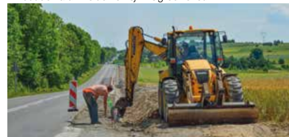
Budowa chodnika w Gieble Kolonii