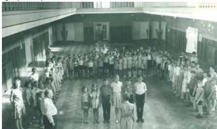
Apel wieczorny. Kolonie letnie Cementowni „Wiek”, Elbląg, 1964 turnus I