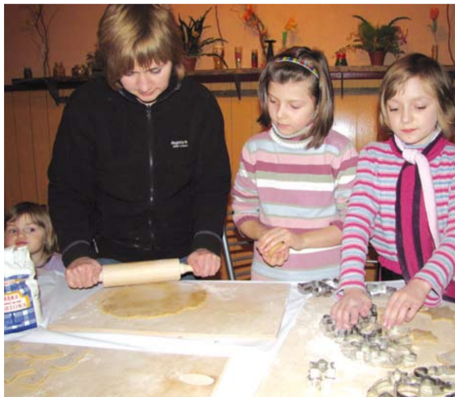
Wspólne pieczenie pierników w Domu Kultury w Ogrodzieńcu

CZYNNE: pn-pt: 7.00-20.00, sob: 7.00-14.00