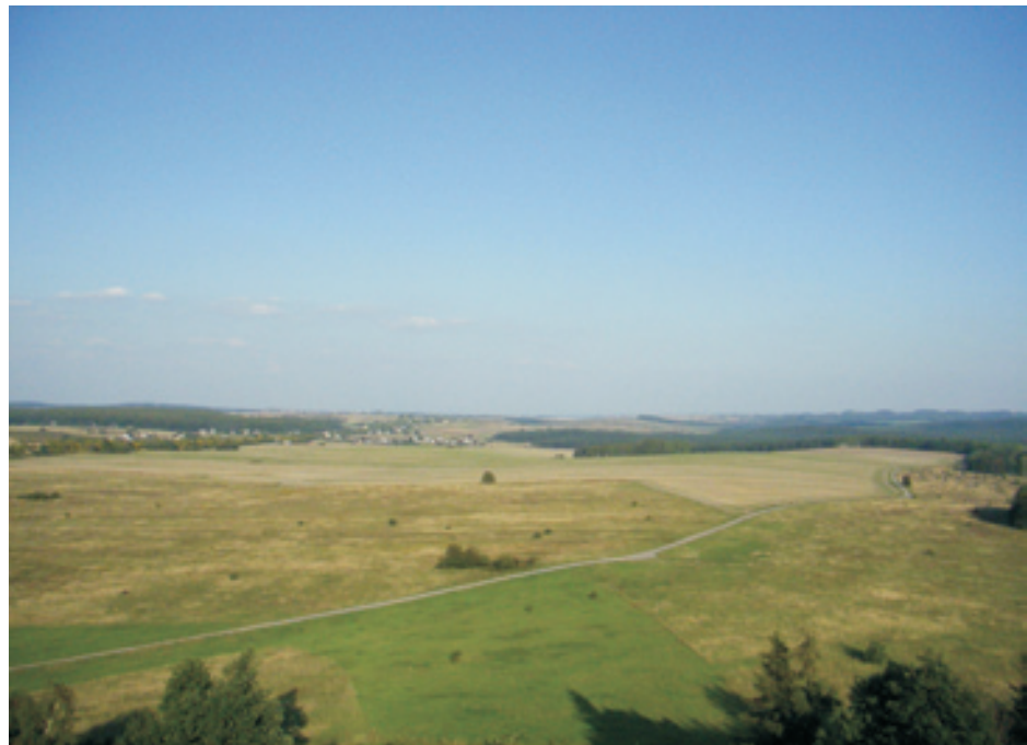
Jakub Cygan - Kilka kroków od mojego domu...