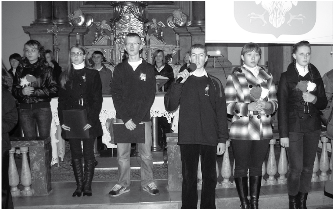
Występ artystyczny uczniów Gimnazjum w Ogródzieńcu w Kościele Parafialnym

S pokojnych, zdrowych, radosnych świąt Bożego Narodzenia spędzonych w serdecznym gronie rodzinnym oraz wszelkiej pomyślności w Nowym Roku. życzy Zarząd i Pracownicy Przedsiębiorstwa Komunalnego Ogródzieniec Sp. z o.o.