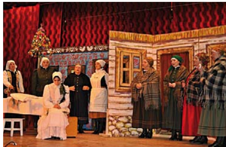
Zespół Folklorystyczny Wrzos