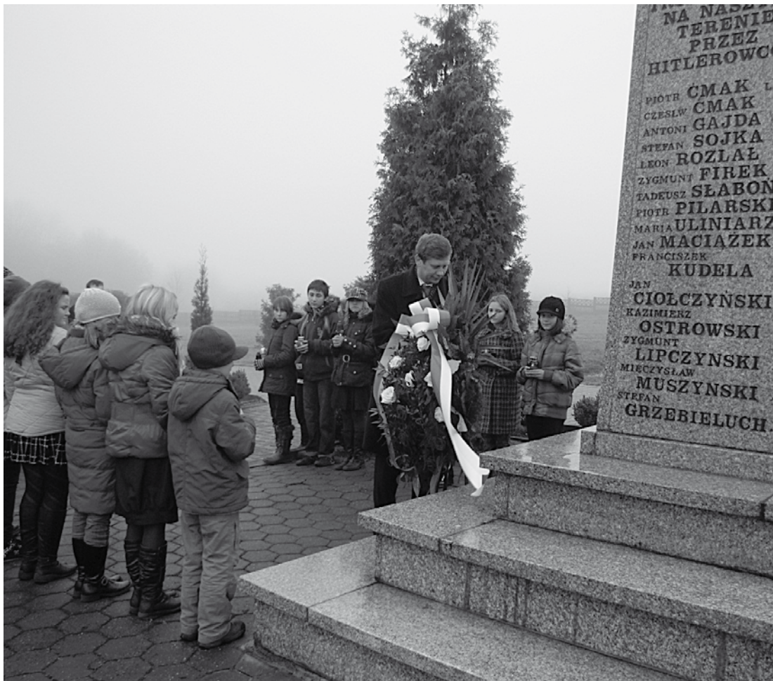
Pod Pomnikiem Poległych kwiaty składają przedstawiciele władz samorządowych i młodzież szkolna