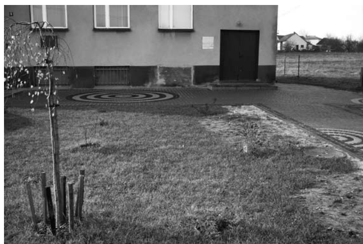
Skwer przed remizą w Ryczowie Kolonii