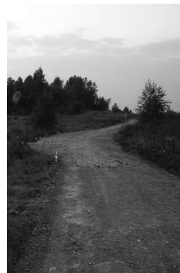
Jedna z zatoczek w trakcie przygotowania – od strony Ryczowa