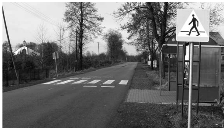
Pobocza i pierwsze pasy przy ul. 3-go Maja w Ryczowie Kolonii