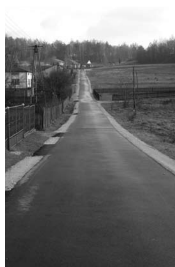
Nowa droga od strony Ryczowa Kolonii