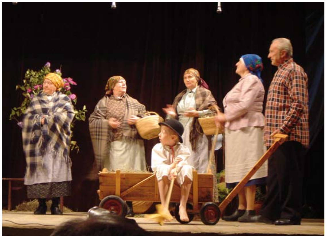
Występ Wrzosa w Tarnogrodzie