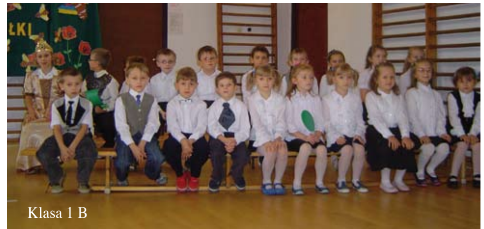
Klasa 1 B

Z bliża się koniec sezonu turystycznego roku 2008. Mamy za sobą ładną wiosnę, kapryśne lato i paskudną, dotychczas, jesień, ale liczymy, że sezon nie zakończy się wraz oficjalną datą 31 października, tylko czeka nas długa złota polska jesień.