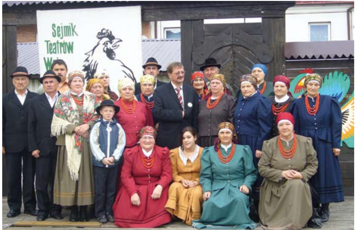
Pamiątkowe zdjęcie Wrzosa