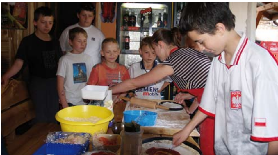
W pizzerii Tiamo