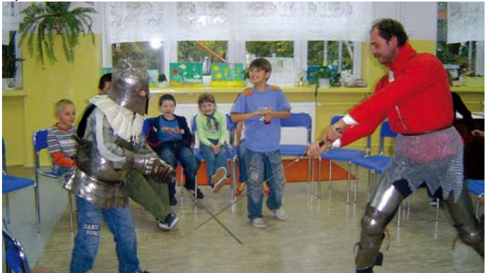
Zajęcia z rycerzem