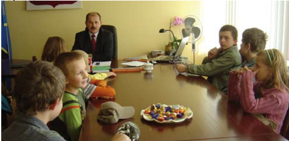
Spotkanie z Burmistrzem