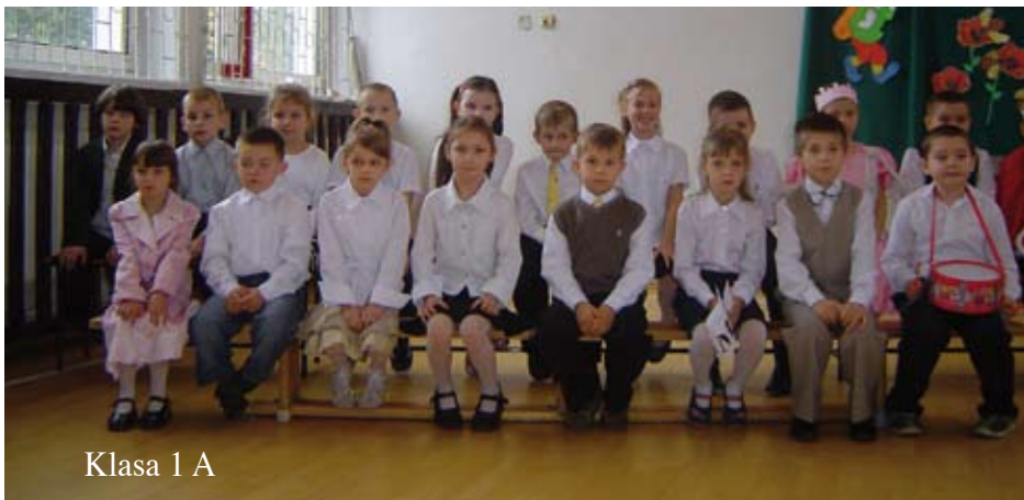
Klasa 1 A