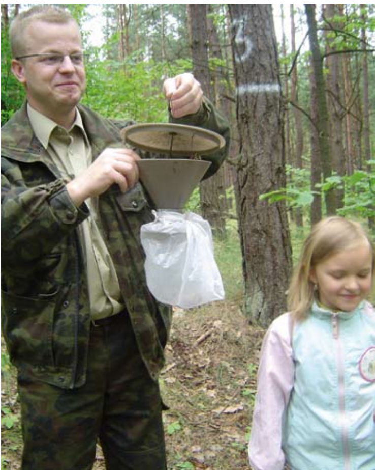
Spotkanie z leśniczym.