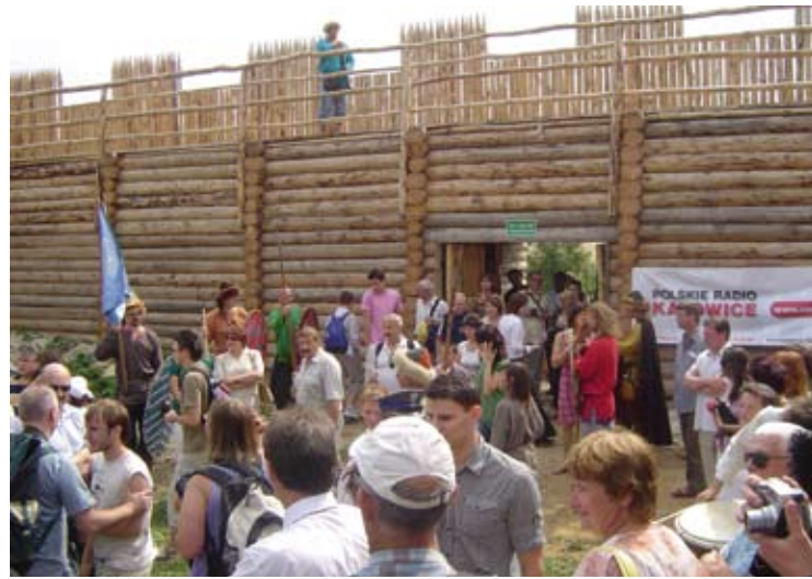
W tle drewniana palisada muru obronnego.

marszałkowskiego, samorządu powiatowego i gminnego, przedstawiciele Zespołu Parków Krajobrazowych i Wojewódzkiego Konserwatora Zabytków, archeologów, dziennikarzy. Związujący