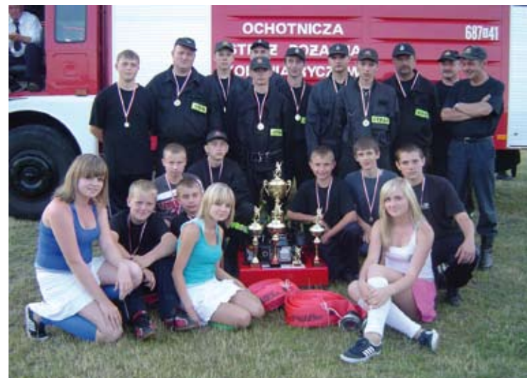
Zwycięskie drużyny - Męska i Młodzieżowa Drużyna OSP z Ryczowa-Kolonii wraz z dziewczętami z zespołu Apogeum.