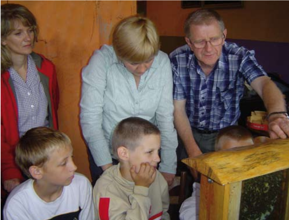
Spotkanie z pszczelarzem.

Pracownicy i dzieci ze świetlicy w Miejsko – Gminnym Ośrodku Kultury w Ogrodzieńcu składają serdeczne podziękowania za pomoc w zbieraniu makulatury Miejsko – Gminnej Bibliotece Publicznej, Zarządowi Gmin Jurajskich, Gminnemu Centrum Informacji, pracownikom Banku Spółdzielczego, Samodzielnemu Publicznemu Zakładowi Opieki Zdrowotnej oraz Zarządowi Komunalnemu.