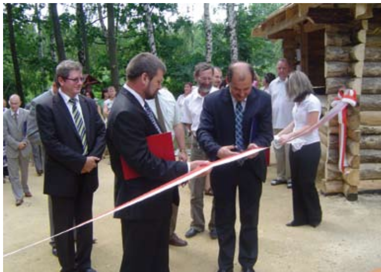
Uroczyste przecięcie wstęgi – Góra Birów otwarta.

uroczyste przecięcie wstęgi, symbolizujące oficjalne otwarcie dla turystów Grodu na Górze Birów. Wśród zaproszonych gości byli m.in. parlamentarzyści, przedstawiciele wojewody, urzędu