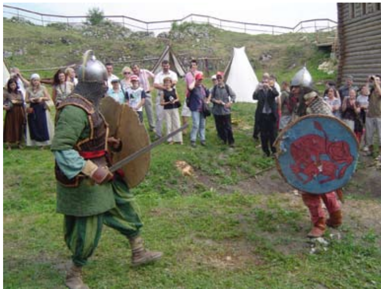
Popisy wojów przyciągnęły uwagę gości.