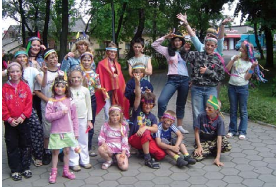
Uczestnicy zajęć podczas zabawy w Indian.