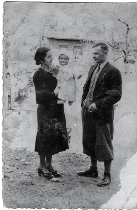
... z żoną i córką.