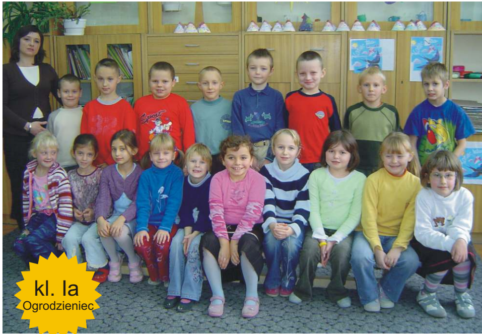
kl. Ia Ogrodzieniec