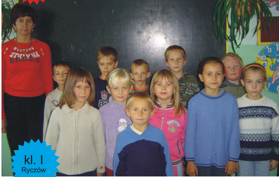
kl. I Ryczów