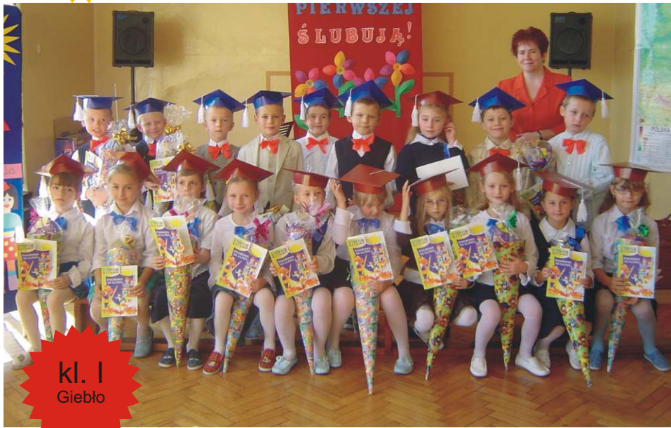
kl. I Giebło