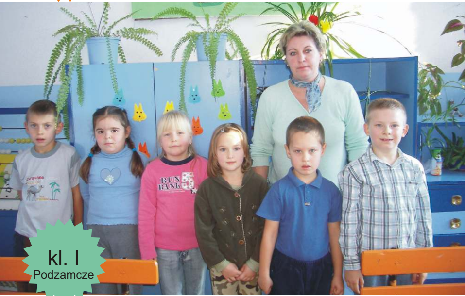
kl. I Podzamcze