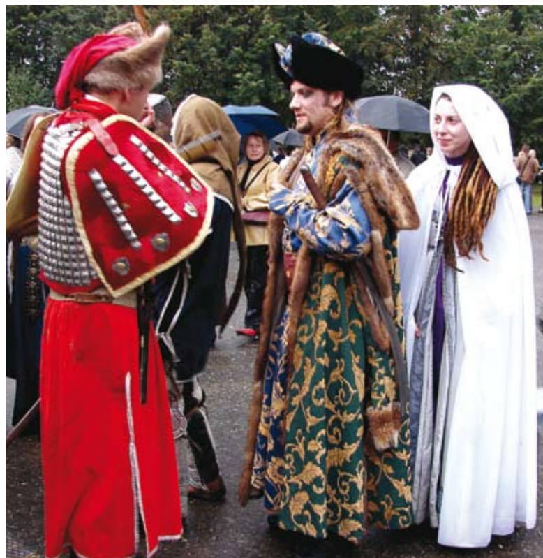
Historyczne postacie z Zamku Ogrodzienieckiego też wzięły udział w finałowej imprezie (Kasztelan Warszawski, Biała Dama i rycerze).