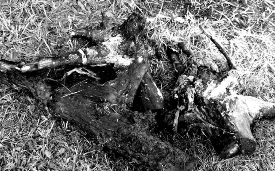
Korzenie, które wrzucono do studzienki kanalizacyjnej. wrzesień-październik 2007