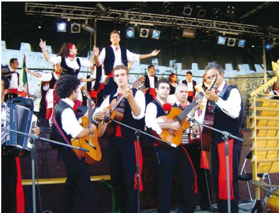
... i grają.