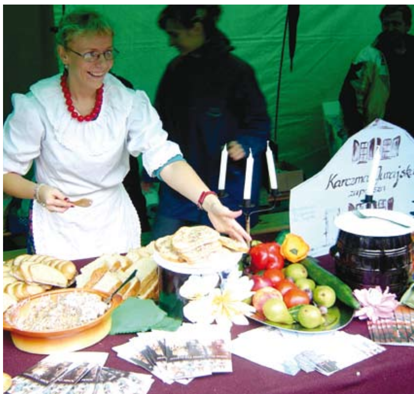
Stoisko promujące regionalną kuchnię gminy Ogrodzieniec podczas finałowej imprezy w Częstochowie.