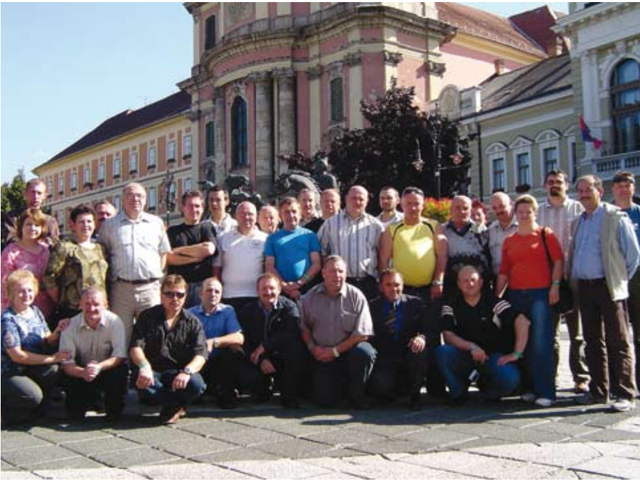
Delegacja z Ogrodzieńca