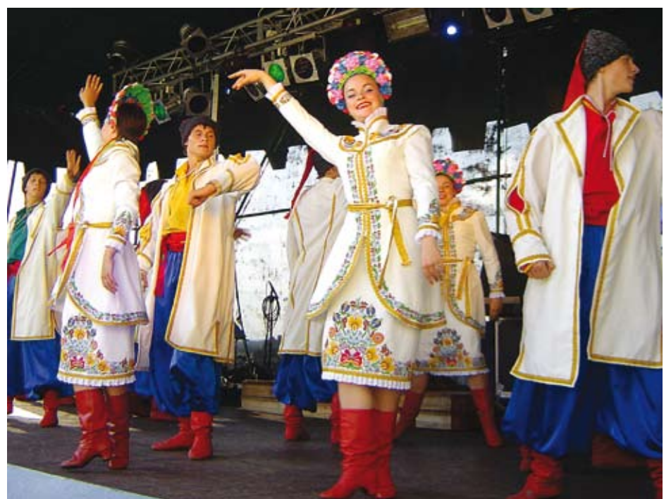
Młode Ukrainki zachwycały tańcem i ...urodą

BLACHA TRAPEZOWA TANIO! TEL. 0-692 328 277