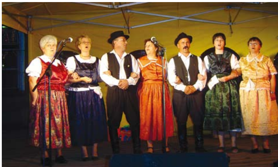
Goście z Węgier.