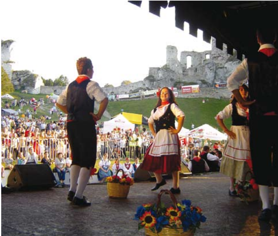
Studenci z Włoch tańczą...