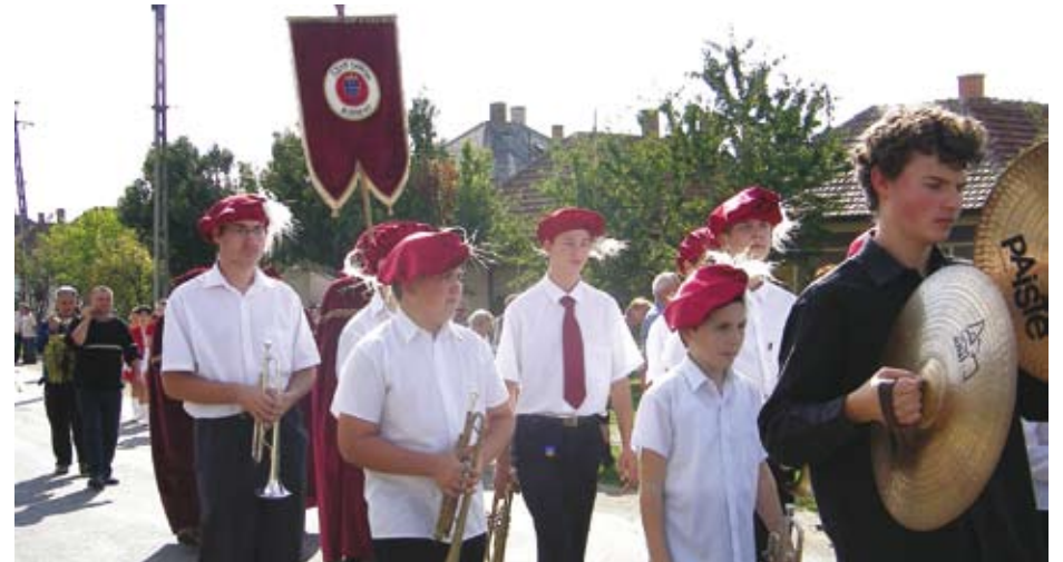
Parada z okazji winobrania w Bogácsu

Na zaproszenie partnerskiej gminy Bogács w dniach 28-30. 09 br. przebywała na Węgrzech delegacja z naszej gminy, która składała się z radnych Rady Miejskiej w Ogrodzieńcu i reprezentacji gminnych jednostek OSP. Wyjazd miał charakter wymiany doświadczeń na poziomie samorządu i lokalnych społeczności obu gmin.