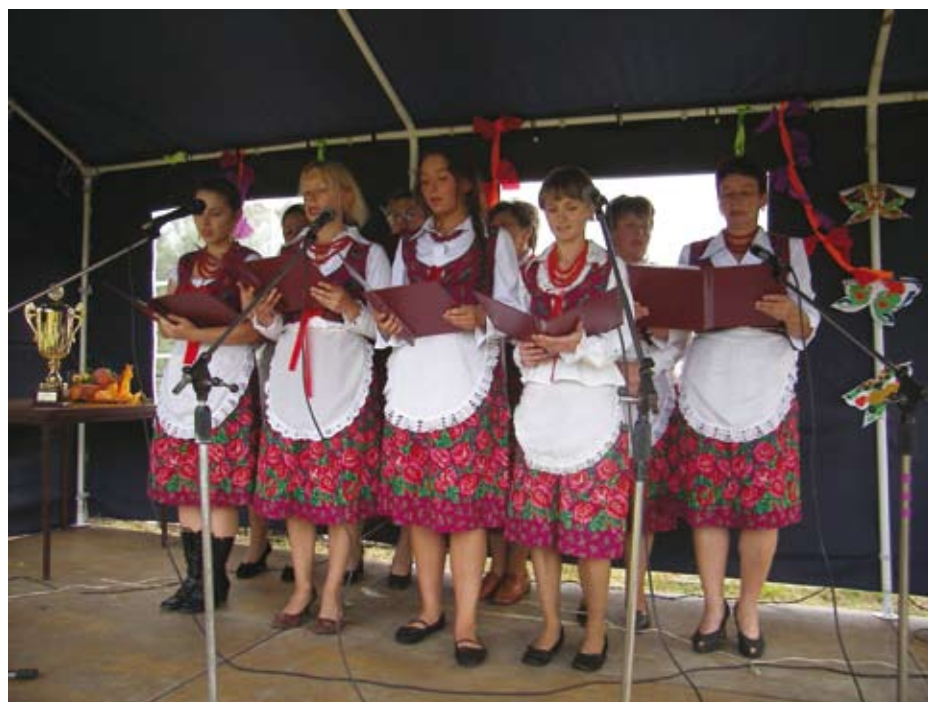
Debiut artystyczny KGW Kielkowie.