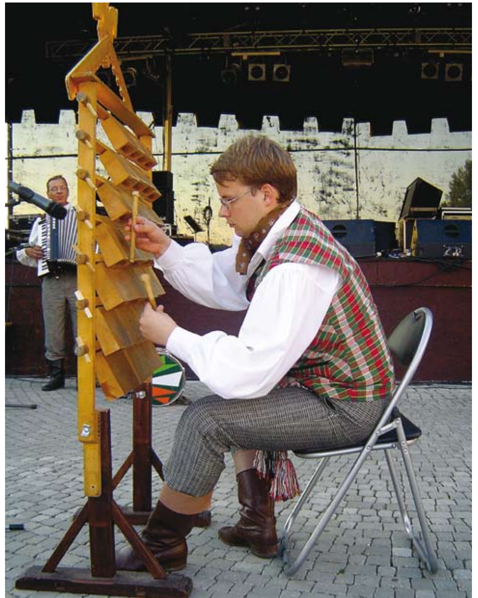
Solista kapeli ludowej z Litwy.