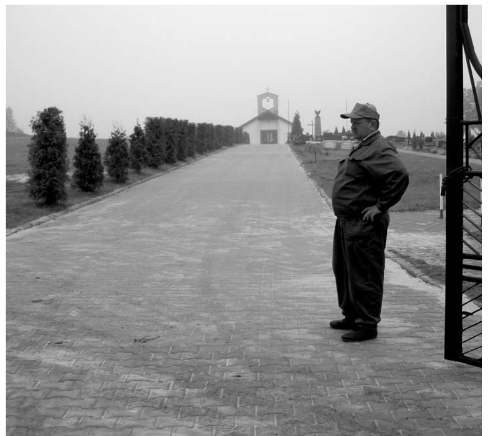
Aleja już gotowa

Z przyjemnością Państwa informujemy, że pracownicy Zarządu Komunalnego zakończyli wykładanie kostką głównej alei na Cmentarzu Komunalnym w Ogrodzieńcu. Wkrótce rozpocznie się malowanie dachu kaplicy cmentarnej, planujemy też dokończenie wykładania kostką alejki bocznej. Mamy nadzieję, że wykonanie tych prac ułatwi Państwu dojście do grobów bliskich a cmentarz będzie wyglądał estetyczniej.