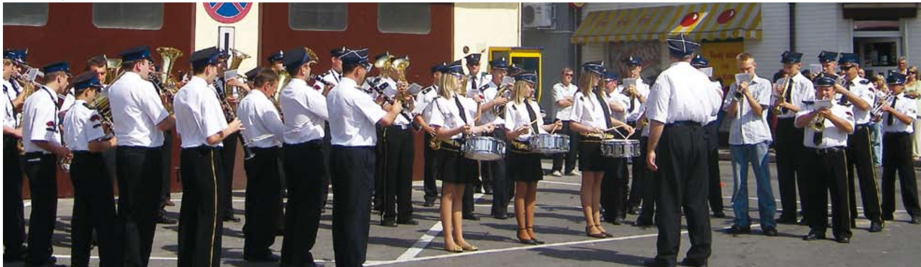
Niedzielny koncert Gminnej Orkiestry Dętej.