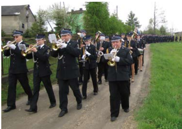
Przemarsz przez Mokrus