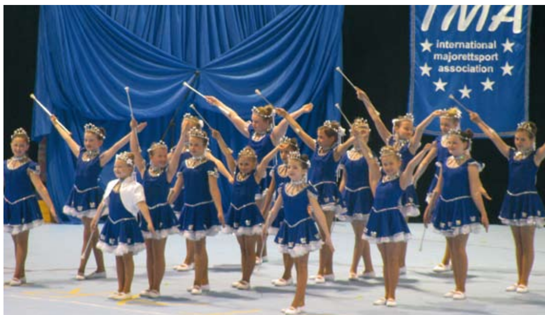
Grupa kadetek podczas Mistrzostw Polski w Opolu