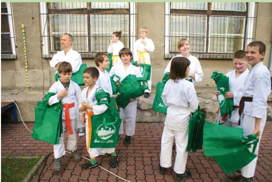
Uczestnicy festynu majowego rozdają ekologiczne torby w ramach akcji „Mój Eko Ogrodzieniec”