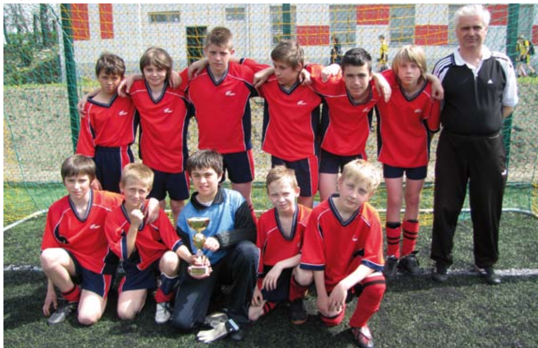
Zwycięska drużyna -Szkoła Podstawowa w Ogrodzieńcu