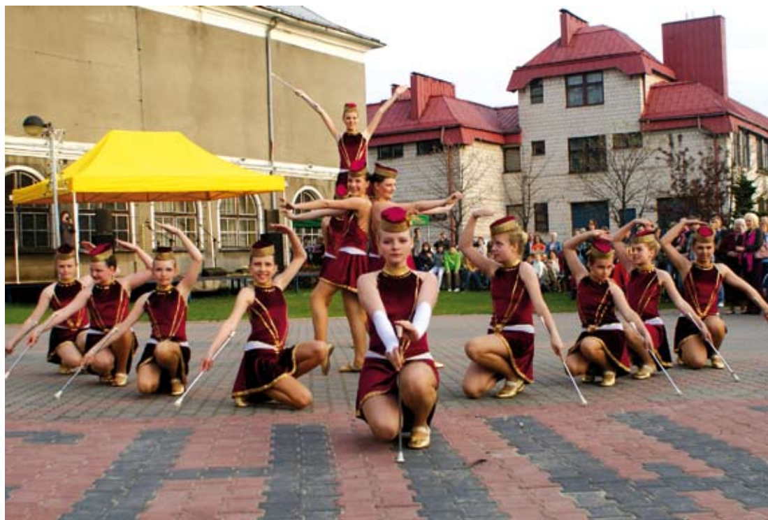
Zespół Mażorettek - grupa juniorek