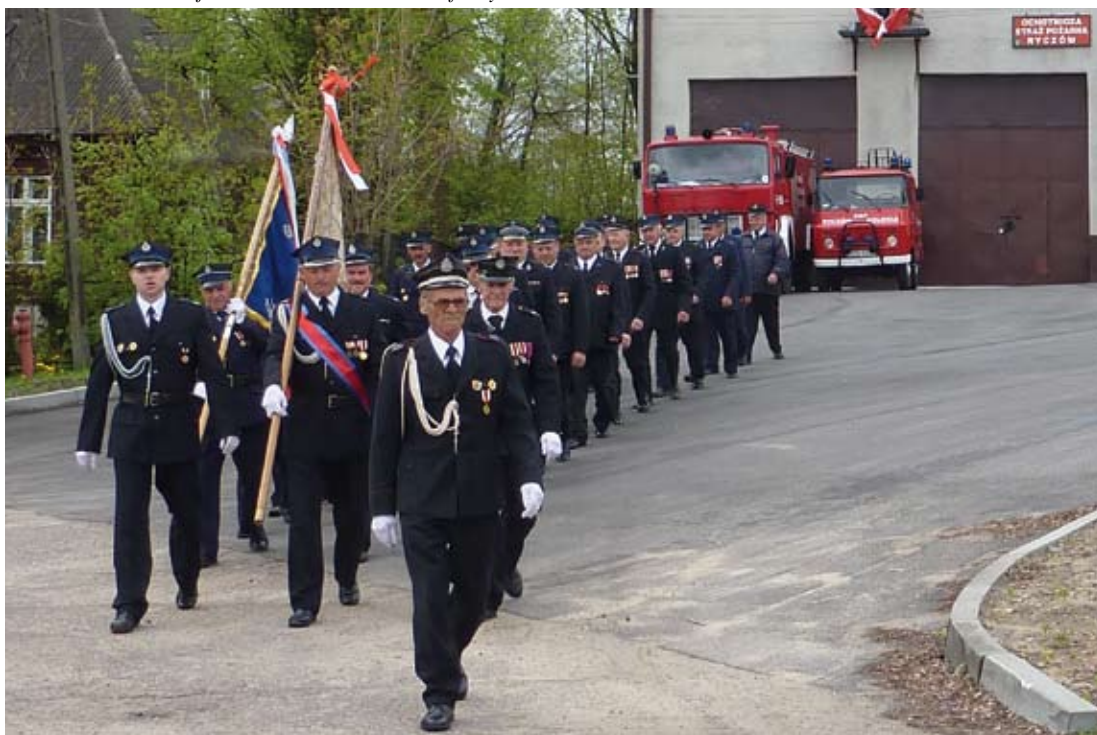
Święto Patrona Strażaków w Ryczowie z udziałem jednostek OSP Ryczów i OSP Ryczów Kolonia - 3 maja 2010.

Członkowie Dziecięco-Młodzieżowej Orkiestry Dętej podczas ceremonii składania kwiatów.