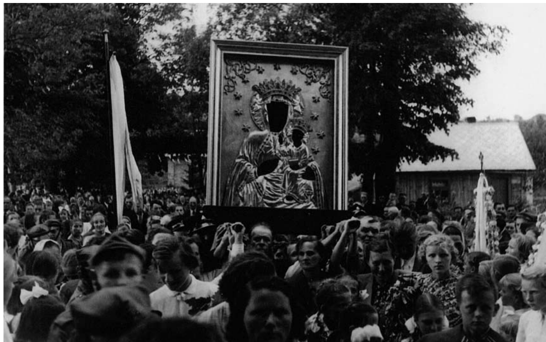
Procesja do Skałki