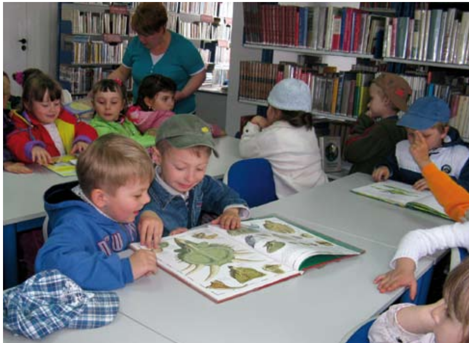
Przedszkolaki w Bibliotece