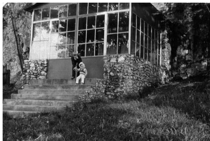
W latach '80