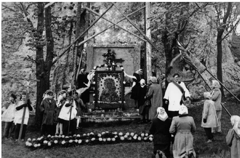
Strojenie ołtarza w Skałce