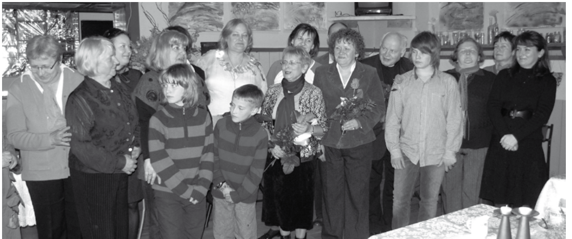
Wspólne zdjęcie miłośników poezji