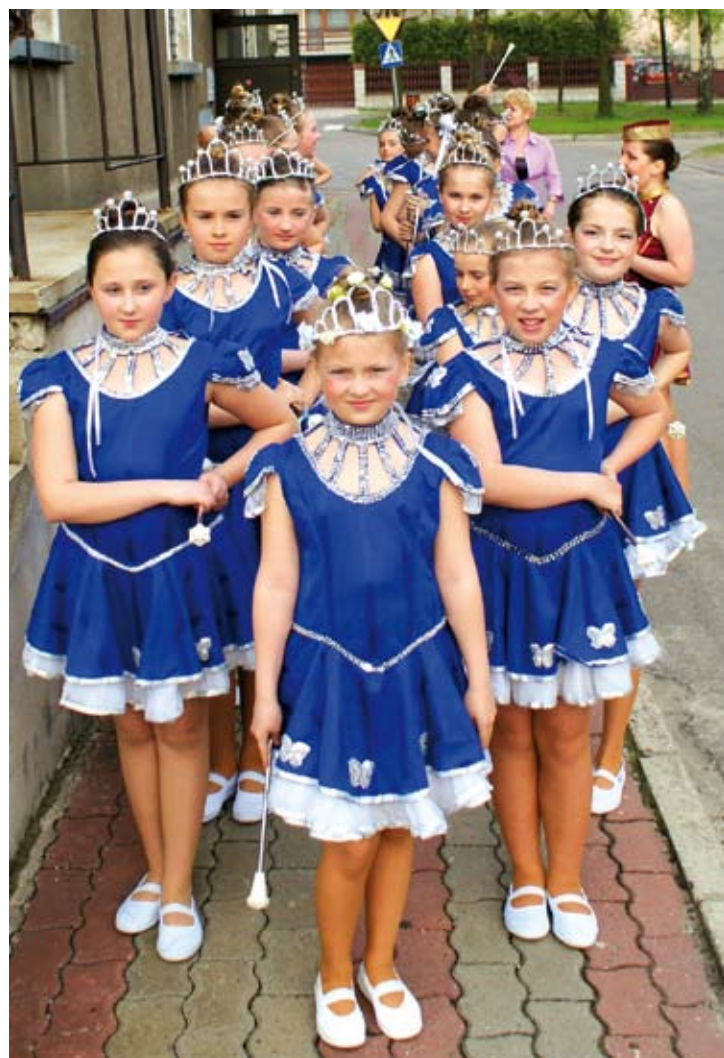
Zespół Mażorettek - grupa kadetek

Na hali sportowej w Gimnazjum w Ogrodzieńcu w dniu 29 marca odbył się międzypaństwowy mecz piłki siatkowej juniorek do lat 19 Polska-Belgia. Reprezentacja Polski pokonała Belgię 3:2. Gra była bardzo zacięta. O sukcesie przesądziła dobra postawa polskich atakujących i konsekwentna gra całego zespołu.