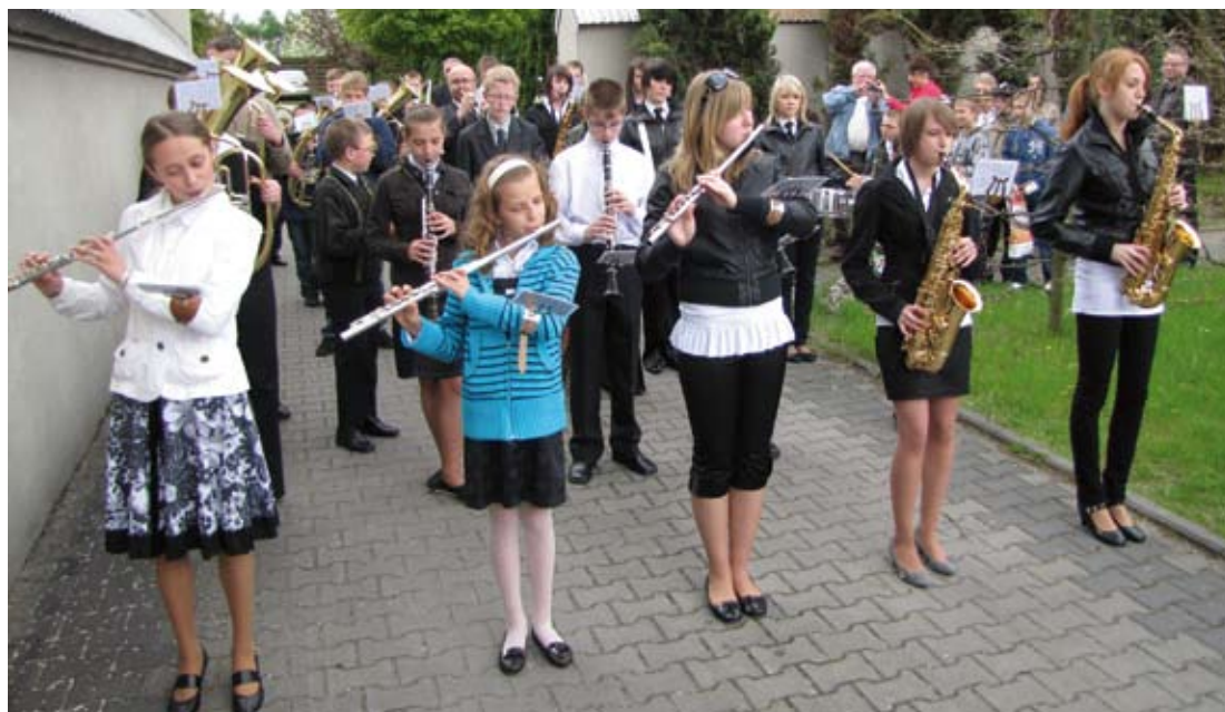
Dziecięco-Młodzieżowa Orkiestra Dęta podczas koncertu 3 maja przed Kościołem Parafialnym w Ogrodzieńcu