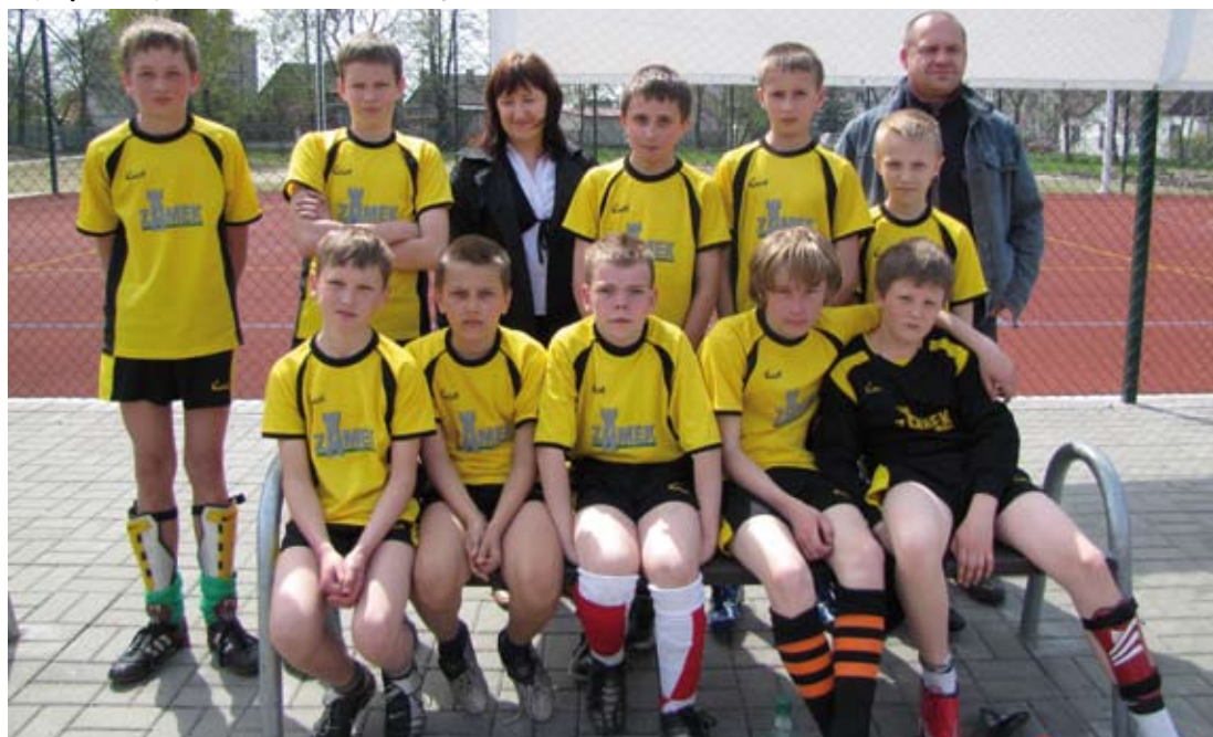
Zdobywcy czwartego miejsca - Szkoła Podstawowa w Giełle