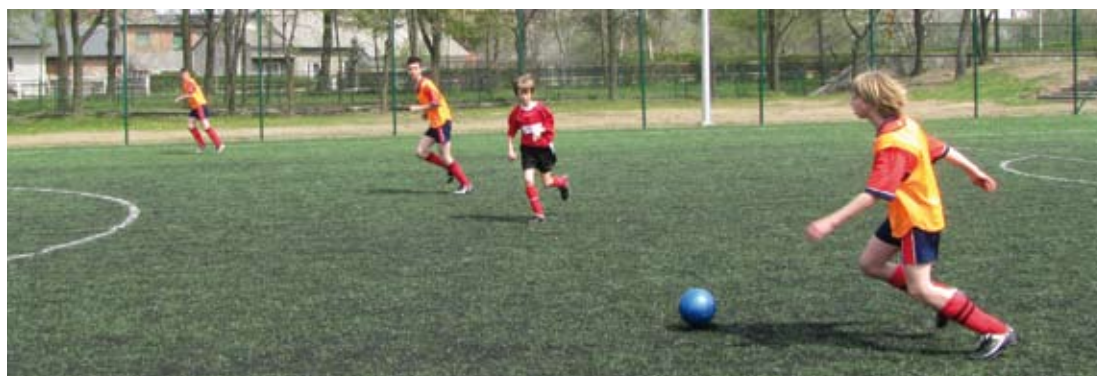
Rozgrywki na „Orliku”