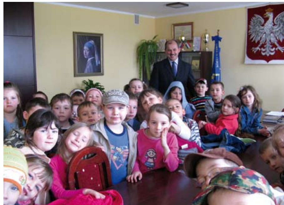
Przedszkolaki w gabinecie Burmistrza