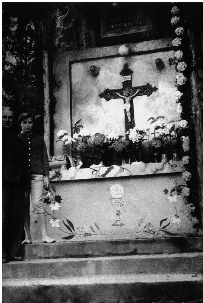
Ołtarz przy skale przed wybudowaniem kaplicy