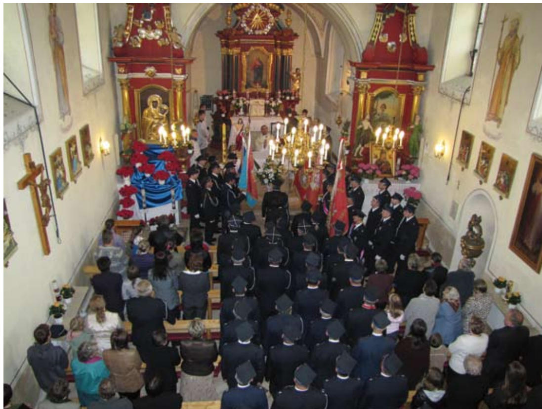
Nabożeństwo w intencji strażaków w Kościele Parafialnym w Gieble