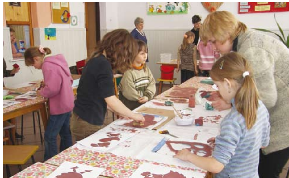
Zajęcia plastyczne w SP w Ryczowie zorganizowane przez MGOK w Ogrodzieńcu