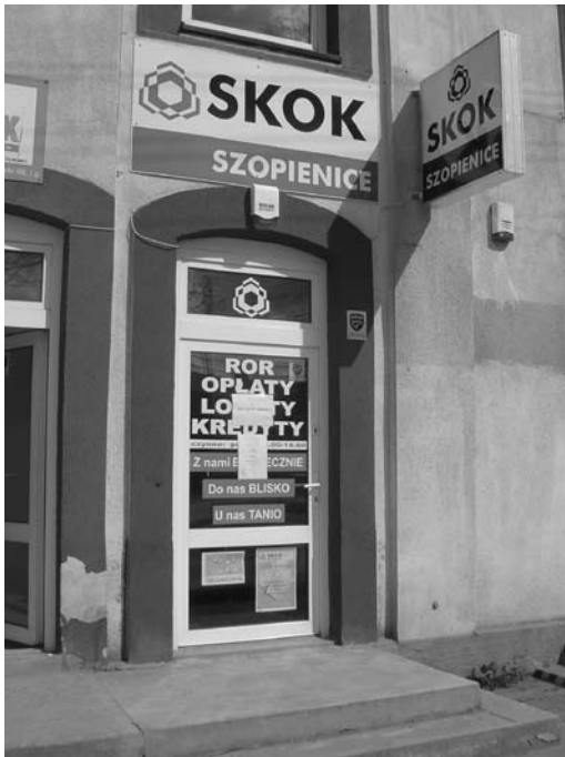
Ogrodzieniec, ul. Kościuszki 66