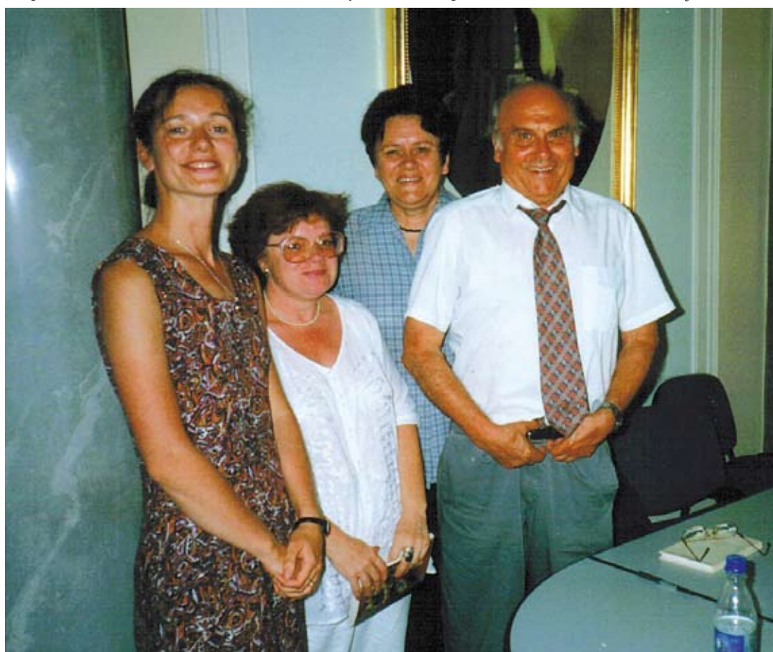
Autorka tekstu (druga z prawej) na spotkaniu z Ryszardem Kapuścińskim