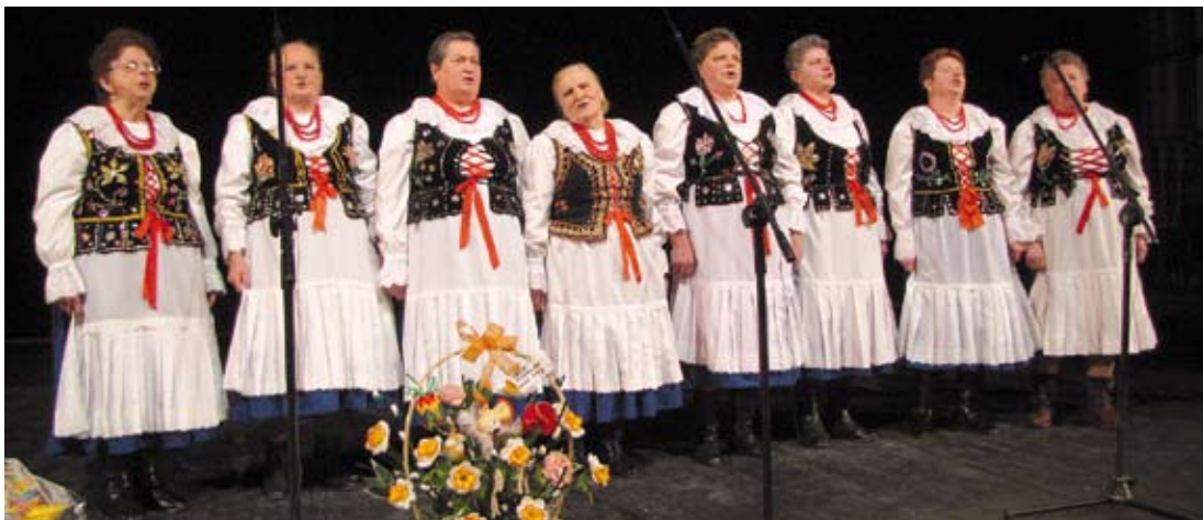
Występ KGW Ryczów