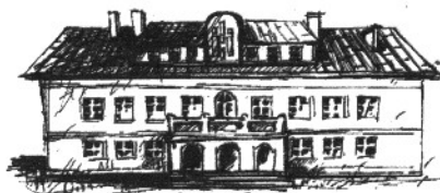
Miejsko-Gminny Ośrodek Kultury w Ogrodzieńcu

Zapraszamy do współpracy, czekamy na Państwa pomysły, opinie i wrażenia. Jesteśmy otwarci na wszelkie Państwa propozycje.