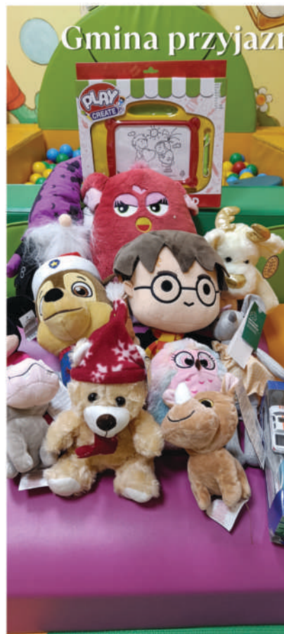
Gmina przyjazna Maluszkom

Z okazji Dnia Babci i Dziadka od maluszków popłynęły życzenia dla swoich kochanych babć i dziadziusiów. Czas karnawału to okazja do przebieranych bali i zabawy – z tej okazji podczas zajęć powstawały maski karnawałowe. W dniu 14 lutego Szczęśliwych Walentynek dla wszystkich życzyły Jurajskie Maluszki. A w Tłusty Czwartek kosztowaliśmy pączki i karnawałowe pyszności. Teraz za oknem coraz częściej przez chmury przebija się słonko i robi się coraz cieplej. W oczekiwaniu na wiosnę maluszki malują kolorowe kwiaty, pszczołki i słoneczko.