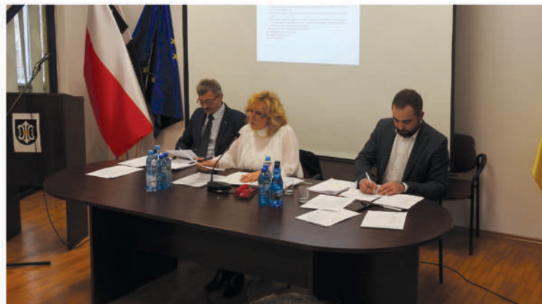
Dochody i wydatki, przychody i rozchody budżetu Gminy Ogrodzieniec na 2024 rok