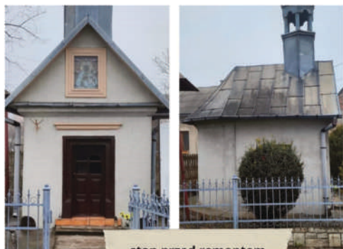
stan przed remontem