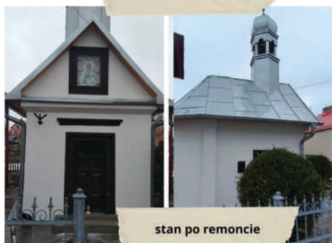
stan po remoncie

Zadanie realizowane w ramach programu Ochrona Zabytków ze środków finansowych Ministra Kultury i Dziedzictwa Narodowego pochodzących z budżetu państwa. Zadanie polegało na przeprowadzeniu prac konserwatorskich przy kapliczce w Podzamczu w celu powstrzymania postępującego procesu degradacji zabytku. Przeprowadzenie prac renowacyjnych i wyposażenie w bezpieczne instalacje pozwoliło na trwałe włączenie zabytkowego obiektu do szlaku turystycznego obejmującego warownie jurajskie, w tym zamek w Podzamczu ściśle związany historycznie z kaplicą. Wyremontowana kapliczka będzie dodatkowym punktem na mapie turystyki sakralnej w Podzamczu, trwale przywracając historyczne funkcje lokalnego miejsca kultu.